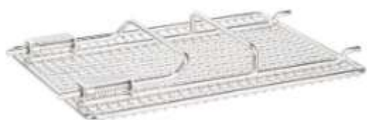
КРЫШКА ДЛЯ ТРАНСПОРТИРОВОЧНОЙ КОРЗИНЫ, НЕРЖ. СТАЛЬ 18/10