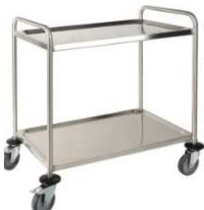
ТЕЛЕЖКИ ЛАБОРАТОРНЫЕ 1